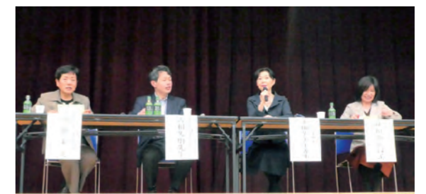
パネルディスカッションの先生方